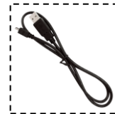
Micro USB 數據線